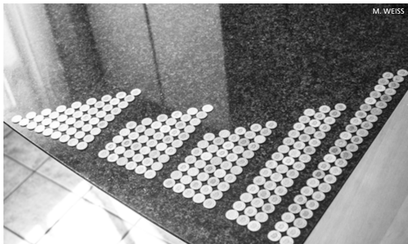
Alle Zahlentreppen mit der Summe 45

Es ist wichtig, dass den Schülerinnen und Schülern beim entdeckenden Lernen im Mathematikunterricht ihr eigenes Vorgehen auch bewusst gemacht wird. Dies kann auf unterschiedliche Weise erreicht werden.