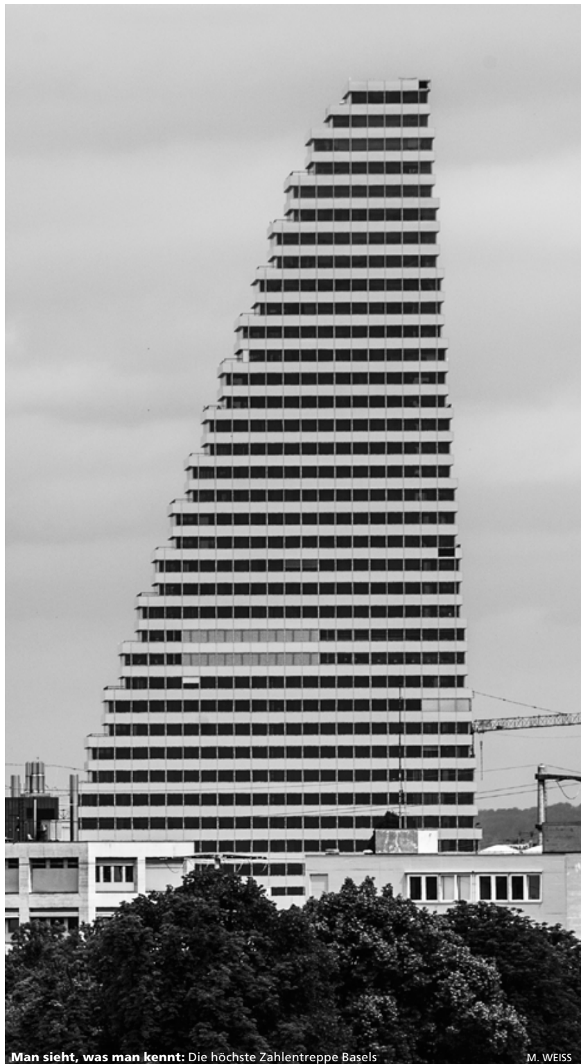
Man sieht, was man kennt: Die höchste Zahlentreppe Basels

Das AVS interessiert sich übrigens durchaus auch für die Ansätze entdeckenden Mathematikunterrichts, die in diesem Artikel dargestellt sind und kann sich sogar vorstellen, dazu eine entsprechende Weiterbildung bei der FEBL zu organisieren. Für Lehrmittelfreiheit kann man sich dort allerdings nicht erwärmen. Zur Einführung des Mathbuchs auch auf dem Niveau A sagte ein ranghohes Mitglied der Lehrmittelkommission dem Autor gegenüber, er wisse, dass die Niveau A-Lehrkräfte ihr aktuelles Lehrmittel (ein Werk aus dem kantonseigenen Verlag mit dem schlichten Titel «Mathematik») behalten wollten. Es sei einfach, damit zu unterrichten, die Lehrkräfte hätten sich daran gewöhnt und es ginge ja auch gut. Aber das Lehrmittel sei