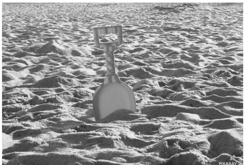
Stolperstein Schatzsuche: Grabe mit der Schaufel exakt hier ein Loch...