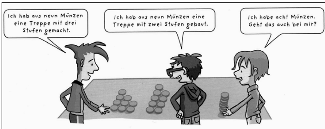
Legen von Zahlentreppen

Das entdeckende Lernen in der Mathematik hilft, das Fach zu entmystifizieren und begreifbar zu machen.